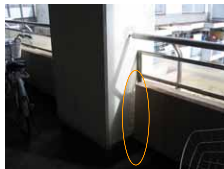
( 窓下の腰壁をカットした例 ) ( ピロティの花台を柱際でカットした例 )